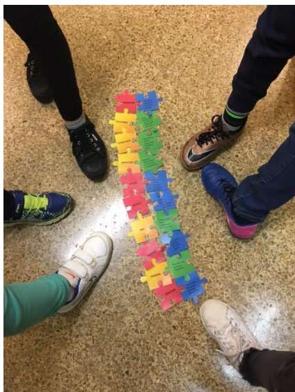
Puzzle de las emociones