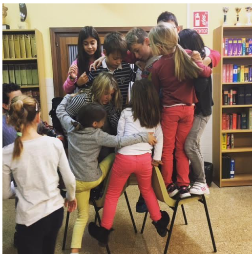
Trabajo en equipo y cooperación